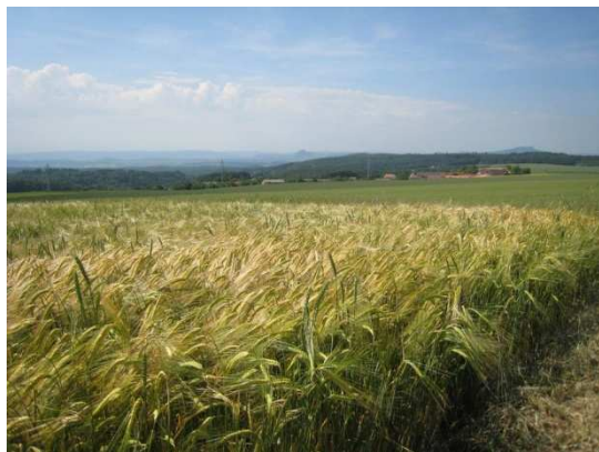
Der Blick in den Hegau

Schatten spendenden Bäumen, Ruhebank und großem Holzfeldkreuz (ca. 0,5 km). Von hier aus bietet der Weg herrliche Sicht auf den alten Dorfkern von Honstetten mit dem aus dem 12. Jahrhundert stammenden „Spiecher“ (alter Turm). Von hier aus