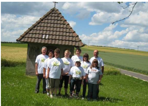
Wanderung zur Kapelle

Mit dem PKW fahren sie vom Bahnhof Engen aus in Richtung Aach durch das Wasserburgertal. Links und Rechts liegen die von der Eiszeit freigelegten Felsen. Am Ende des Tales sehen Sie bereits den