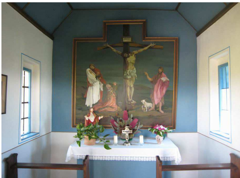
Blick in die Kapelle